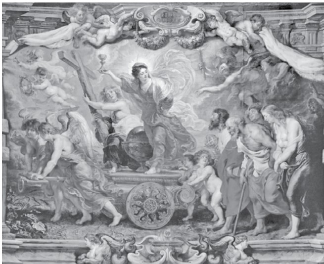
Pietro Paolo Rubens, Trionfo della fede, XVII secolo, Musei reali delle Belle Arti del Belgio, Bruxelles

Viviamo in un tempo in cui la parola «fede» rischia di essere ridotta a una dimensione privata, marginale, quasi opzionale della vita quotidiana. Molti, anche battezzati, percepiscono la religione come un'attività fra le altre: un insieme di tradizioni a cui aderire quando c'è tempo, un sentimento da coltivare come passatempo, un «hobby» spirituale che accompagna, ma non plasma, l'esistenza. Questa visione impoverita tradisce il cuore stesso del cristianesimo.